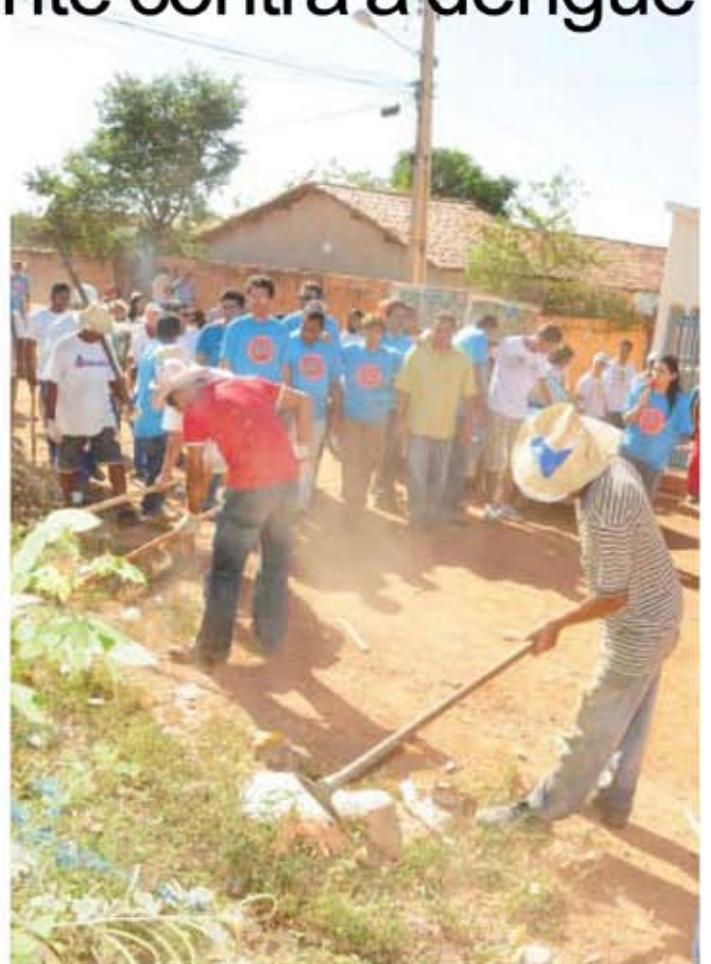
A frente de trabalho limpou os terrenos baldios que servem de criatório para o mosquito