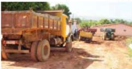
As caçambas recolheram os entulhos jogados nas ruas e terrenos baldios