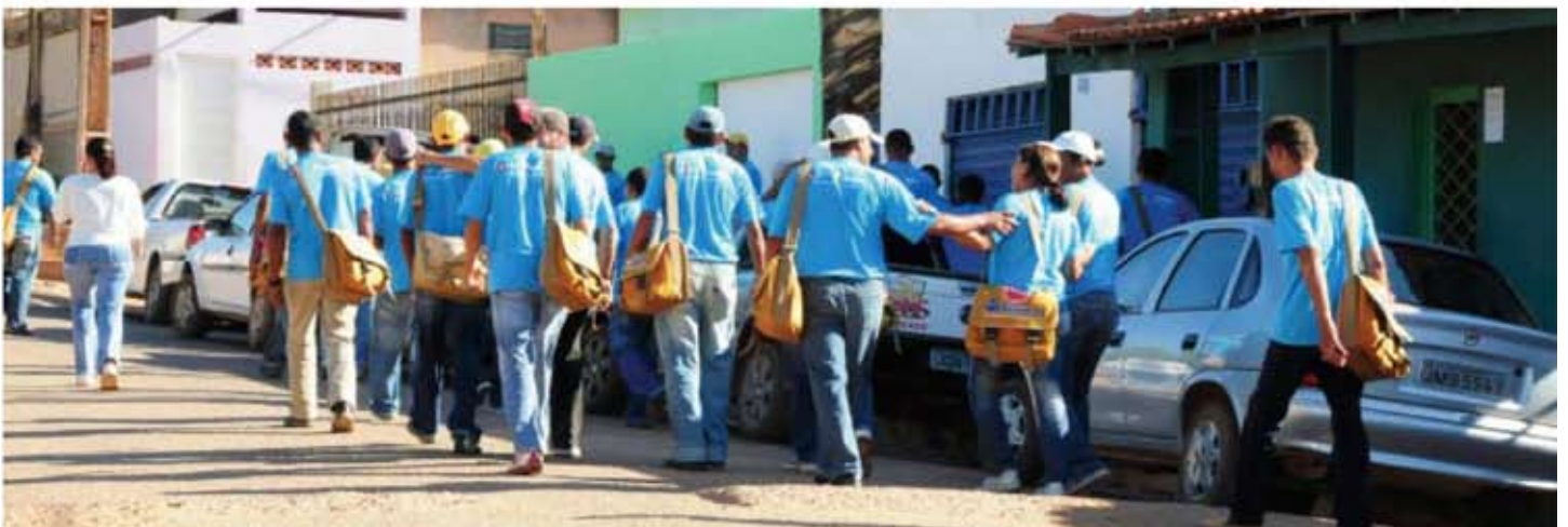
O mutirão contou com a participação de 60 agentes de endemias, que visitarão todas as residências e farão um trabalho de conscientização com os moradores