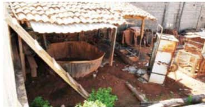
Entulhos, garragas, latas, pneus, caixas d'água sem tampa são locais ideais para a reprodução do mosquito