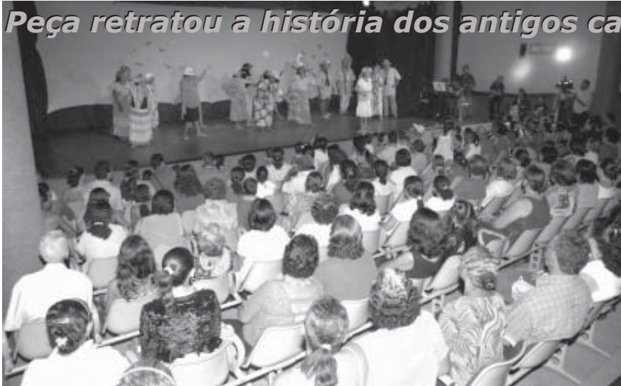
Casa cheia na primeira apresentação do grupo da melhor idade

Peça retratou a história dos antigos carnavais de Barreiras