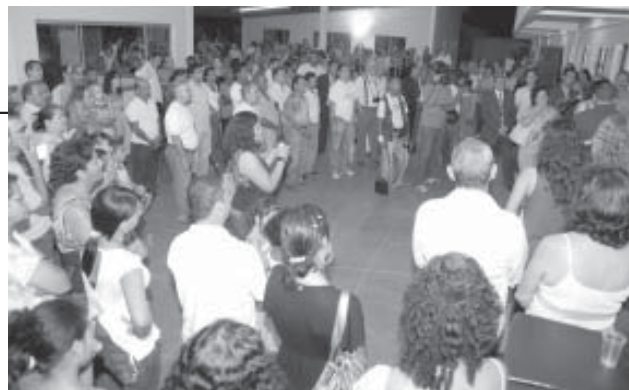
Centenas de pessoas prestigiaram o ato inaugural da nova sede do Colégio Padre Vieira

Endereço: Av. Dr. Clériston Andrade, 729 Centro - Barreiras-BA - Cep: 47.801-900 Site: www.barreiras.ba.gov.br